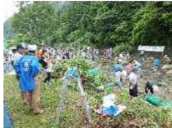
L.池戸会長訪問の美濃LCメインアクト「親子ふれあい魚釣り大会」