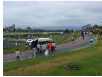
早朝より多くの方が参加しました