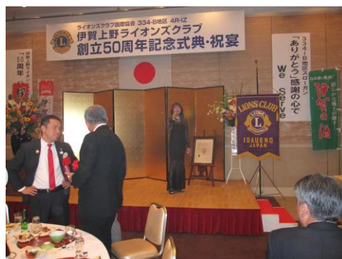
歌謡ショー えりか