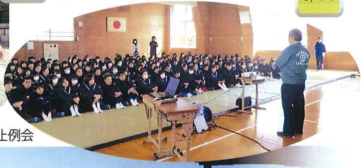
第369回 薬物乱用防止例会