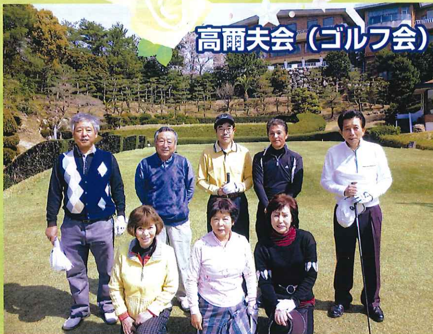
高爾夫会 (ゴルフ会)