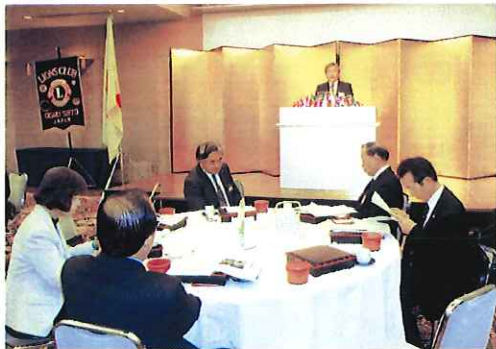
第357回 ガバナー公式訪問