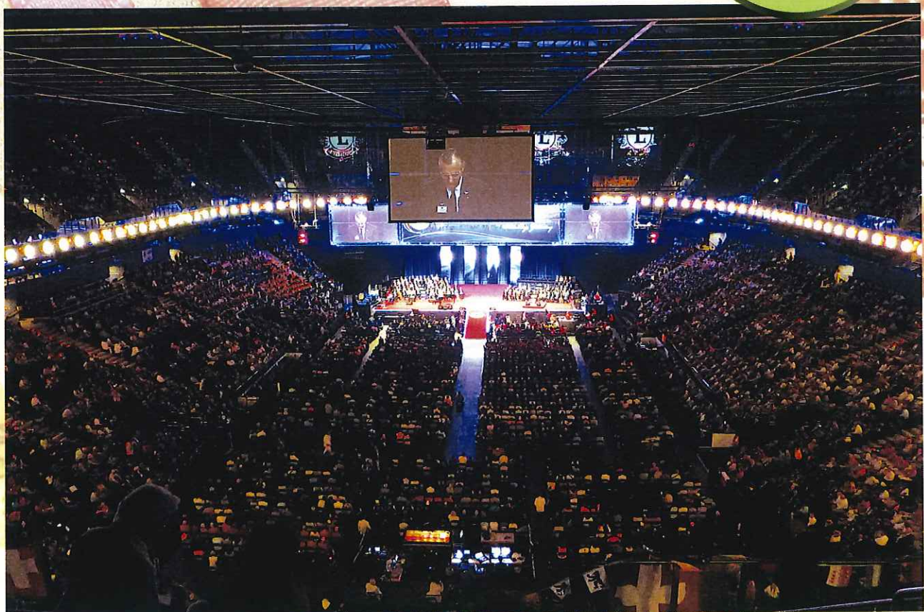
96th Lions Clubs International Convention-Hamburg, Germany