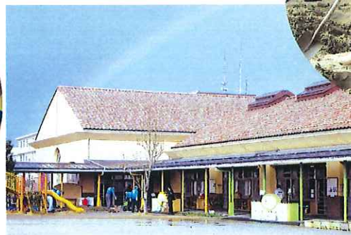
第364回 クリスマス家族会