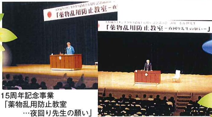
15周年記念事業 「薬物乱用防止教室 …夜回り先生の願い」