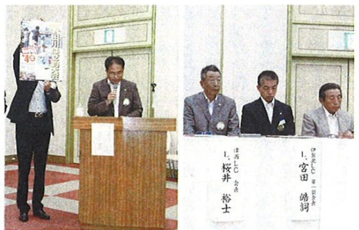
当クラブはぜ釣り大会のPR