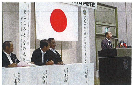
北野地区ガバナーのごあいさつ

さて、いつものことながら例会プログラムに沿って進んでいくのですがどうしても幹事報告の時には時間がかなり押してきておりましたので各クラブの幹事さん達は如何に手短かにまた、的確に報告をしようとして居られました。私ももう少し時間を頂けたら皆さんにわかりやすい幹事報告が出来たのにと時間がない事を理由にお許しを下さい。 とりとめの無い文章ですが急にPR委員長に振られたのでご勘弁願います。