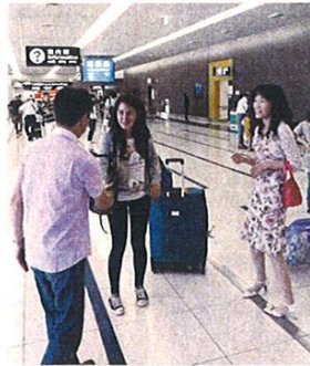
セントレアへお迎え

今回は2度目のYCE生の受入となりました。前回同様イタリアの学生でしたが、嬉しいことに、私たちにとって初めての「娘」でした。早速メールを送り、日本でしたい事、行きたい所、興味のある事柄、食べ物の好みなど、いろいろなることを尋ね、計画をたてるのも楽しい日々でした。できれば観光では味わえないような経験をして帰って