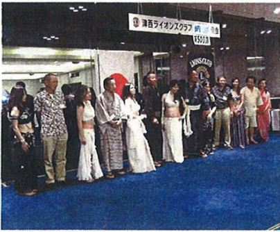
ベリィダンスのメンバーとともに