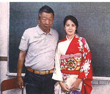
L中井宅のホームパーティ

日、長旅の疲れもあるだろうと思い、ゆっくり家でくつろぎながらイタリアのメラータの街や家族の話などいろいろな話をして、一緒にトランプを楽しみました。 メンバーとともに 各地の観光へ 我が家は第一ホストであったため、キャンプをはさんで前半1週間と後半1週間という日程でした。その間、クラブの委員会ごとに担当の日を決めていただき、伊勢神宮・夫婦岩・鳥羽水族館・真珠島の観光、大阪でのシヨッピン、長島スパランドとアウトレットなど案内していただきました。また、家族でも伊賀上野の観光と市内の名所案内もしました。 さらに、市長表敬訪問と例