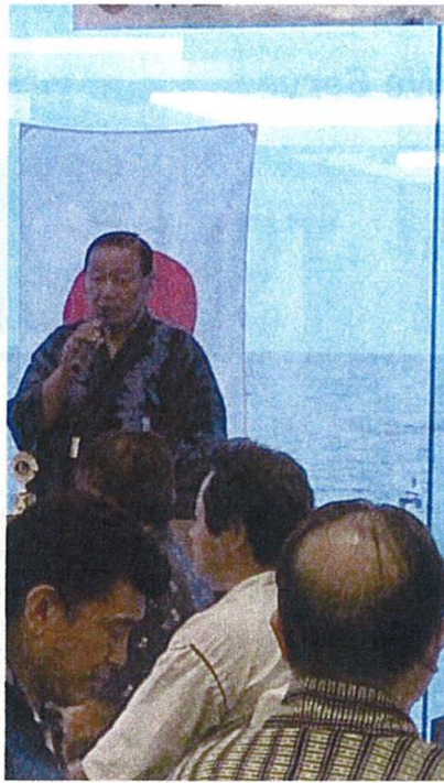
山路ZCのごあいさつ